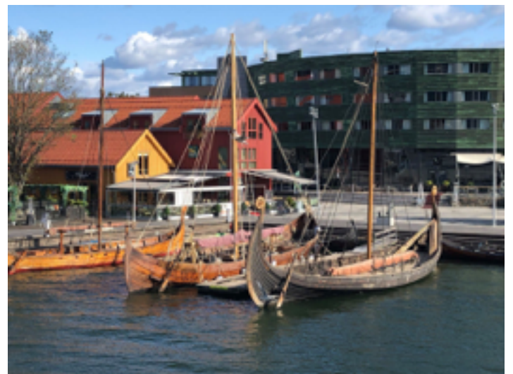
Skipene i sitt rette element i Tønsberg Havn utenfor Vikingodden.

Aller viktigst er imidlertid hensynet til sikkerhet for alle om bord. Der følger vi vårt eget Hovedsmannsråd